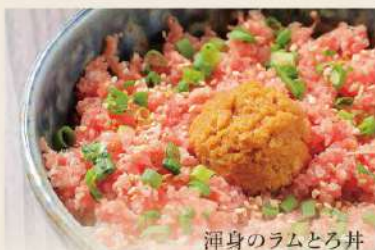
渾身のラムとろ丼

[ しめじ、キクラゲ、白菜、玉ねぎ、水菜、ほうれん草、人参、大根、油揚げ、豆腐、くずきり ]