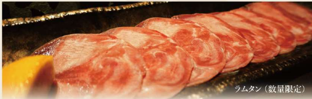
ラムタン (数量限定)